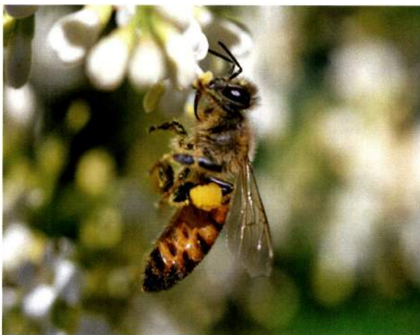
↑ 花粉団子を集めるミツバチ

〈ネズミモチのはちみつ〉 ネズミモチの花から採れるのはちみつは、さらりとした琥珀色をしており、クセがない上品な甘みが特徴です。今年は豊作で、たくさんのはちみつを採ることができました。おいしく栄養豊富な天然の恵みに感謝ですね。