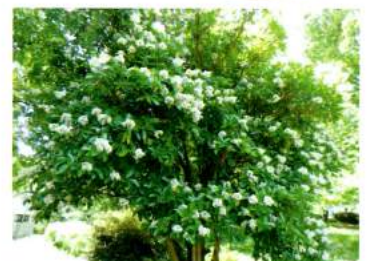
公園や生垣などにもよく植えられています

同属である唐ネズミモチ(中国=唐からきたネズミモチ)の熟した果実を採集して干したものを「女貞子」といい、煎じたり、あるいは焼酎などに付け込んで薬用酒として、病後の体力回復や虚弱体質の改善などの滋養薬とされています。