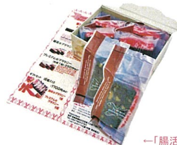
←「腸活ブラウニー」ハッピースイーツ工房

てんさい糖は、体を温めてくれ、おなかに優しい砂糖ともいわれています。「腸活ブラウニー」は、活性炭に興味がある方、腸をキレイにしたい方、おなかの調子が気になる方、活性炭を美味しく食べたい方、健康的で快適な毎日を送りたい方、こんな人におすすめです。