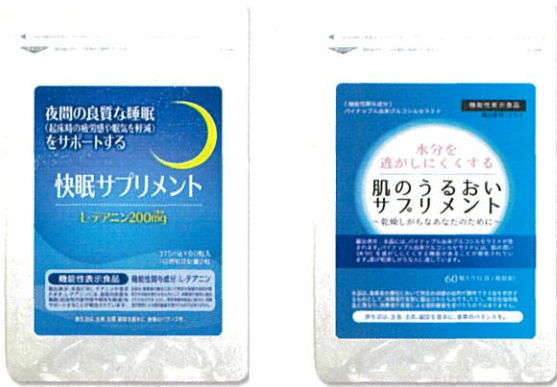
New! 第2弾 「肌のうるおいサプリメント」