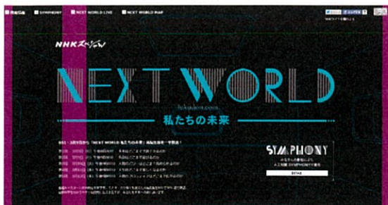
(2015年NHKスペシャル『NEXT WORLD 私たちの未来』)

身体機能を回復し、健康寿命を延ばすNMN 全身の細胞に働きかけるため、加齢による様々なトラブルの 解消が期待できます