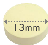
13mm タブレット (丸形)

「疲れ」を感じている方に朗報！スーパーフード「モリンガ」由来、天然の回復成分を配合しました。1日1粒、シーンを選ばず好きなタイミングでエネルギーチャージ！