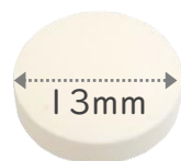
13mm タブレット (丸形)

マスク生活で気になるのは自分の口のニオイ。細菌のかたまりである歯垢は、口臭や口内環境を悪化させます。レモン風味の爽やかな炭酸タブレットで、手軽にスッキリ口内ケア！