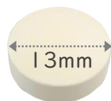
13mm タブレット (丸形)

お肌は、腸の鏡！美肌を実現するためには、実は「美腸」こそが重要です。お米由来の100億個の乳酸菌が腸内で働き、大切なお肌を守ります。