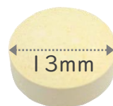
13mm タブレット (丸形)

冷え性の女性、夕方の足のむくみが気になる女性におすすめ！ 食べて10分で体がポカポカする即効性が魅力。